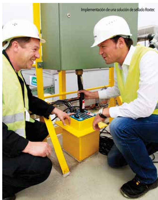
Implementación de una solución de sellado Roxtec

• Ciencias de la Vida: Roxtec ofrece soluciones certificadas adecuadas para incrementar la higiene en el sector farmacéutico, así como en el food&beverages , ayudándolos a tener una protección contra polvo, agua, fauna nociva que deben contrarrestar para mantener una sanidad e inocuidad apropiada, lo que les permite cumplir con certificaciones aplicables en su industria.